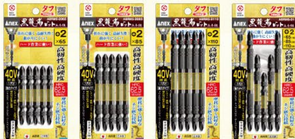
ABRM5-2065 ABRM5-2085 ABRM5-2110 ABRM5-01