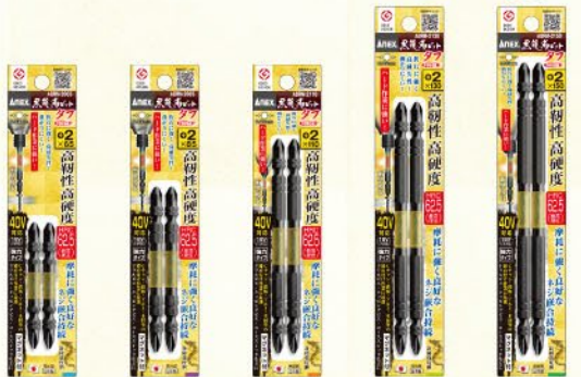
ABRM-2065 ABRM-2085 ABRM-2110 ABRM-2130 ABRM-2150