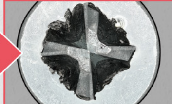
ワニドラ Jr 打撃後